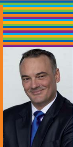
Zoltán Borkai Borkai Zsolt polgármester

Igazi kurióznak ígérkezik Győr város tavalyi kezdeményezése: közös dobolásra hívjuk az egész világ apraja-nagyját a Széchenyi térre! Mindenki részt vehet az örömenélésben, aki szereti a ritmust, és bármilyen ütős eszközzel bekapcsolódik a nagy játékba. Bízom benne, hogy a Győri Tavasz Fesztivál programjai között mindenki megtalálja a kedvére valót, és ismét találkozási pont lesz Győr azok számára, akik a kulturális élmények jegyében szeretnék eltölteni a tavaszi időszakot. Győr városa nagy szeretettel invitálja Önöket a programokra, én pedig jó szórakozást, kellemes élményeket és sok mosolyt kívánok az idej esztendőre.